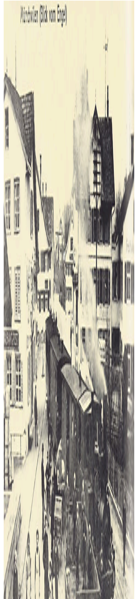
München (Blick vom Engel)