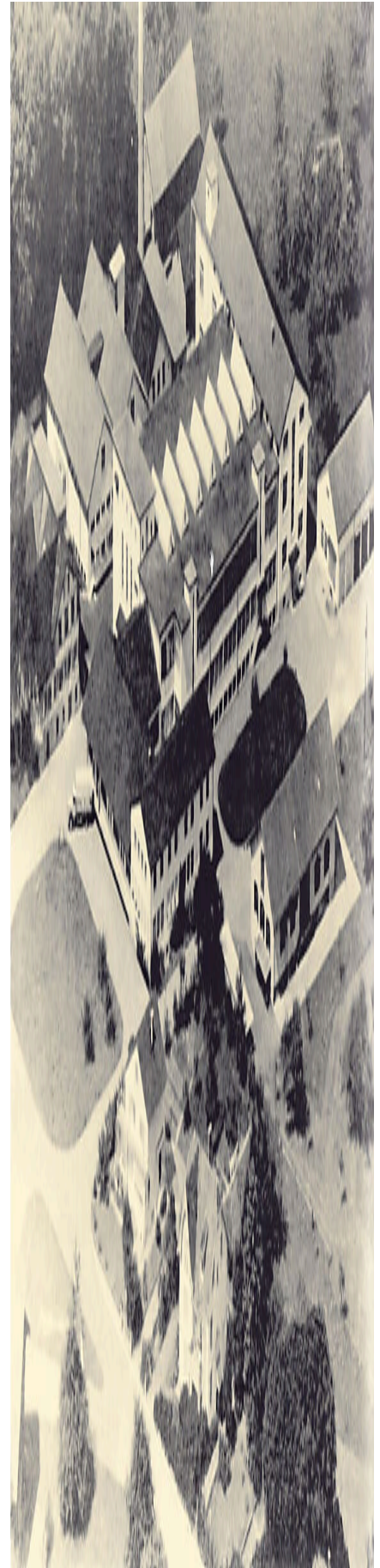
Fabrikanlage der Firma Alfred Sutter im Jubiläumsjahr 1958.