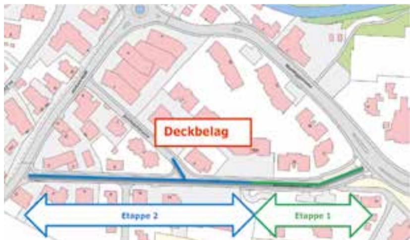
Deckbelagsarbeiten Weinfelderstrasse, Abschnitt Wilerstrasse bis Waldeggstrasse (Pizzeria «Salta in Bocca»).

Gregor Kretz Leiter Amt für Bau und Umwelt