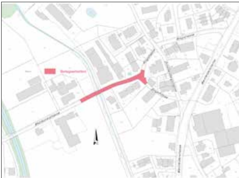
Deckbelagsarbeiten Mezikonnerstrasse Abschnitt Käserei Koller bis Ringstrasse St. Margarethen.

Nachdem im letzten Jahr auf der Mezikonnerstrasse im Abschnitt Murgtalstrasse bis Käserei Koller der erste Teil des Deckbelags eingebaut wurde, wird nun am Dienstag, 30. Juli der Deckbelag auf dem Abschnitt zwischen der Käserei Koller und der Ringstrasse eingebaut. Aus diesem Grund wird die Mezikonnerstrasse voraussichtlich von Montag, 29. Juli, 16 Uhr bis Mittwochmorgen, 31. Juli, 6.30 Uhr in diesem Abschnitt