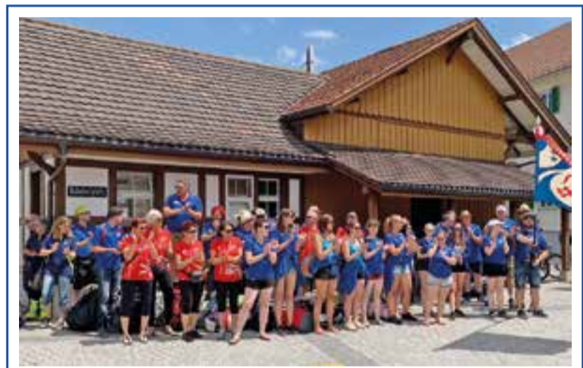
Ein grosses Bravo dem Turnverein Münchwilen für die aktive Teilnahme und die hervorragenden Ränge am eidgenössischen Turnfest in Aarau.