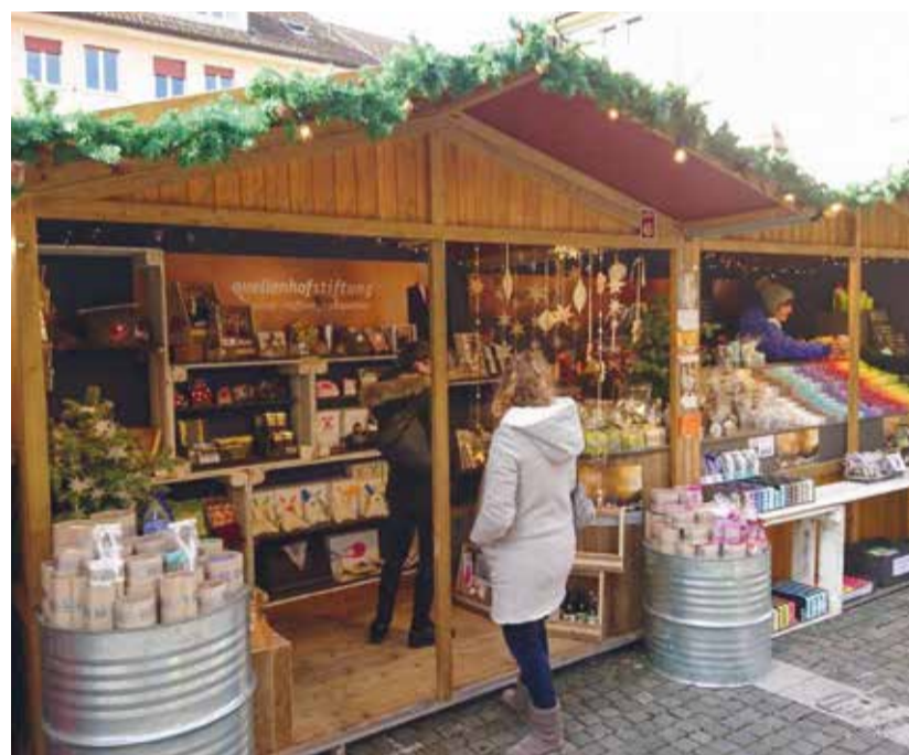
Auf gemütliches Marktstand-Bummeln muss dieses Jahr leider verzichtet werden.

Den Kopf in den Sand stecken oder gar in eine Art Panikstarre verfallen – dies liegt der Vereinigung Münchwiler Firmen (VMF) rund um deren umsichtigen Präsidenten Jürg Hüni jedoch überhaupt nicht. Mit dem der Situation gebotenen Respekt und der notwendigen Vorsicht begegnen sie der aktuellen Lage, versprühen aber gleichzeitig leisen Optimismus im Bezug auf die geplanten Aktivitäten für das kommende Jahr. Der Skitag in Davos im Januar sowie die Generalversammlung des Vereins im Februar sind zurzeit noch fest im