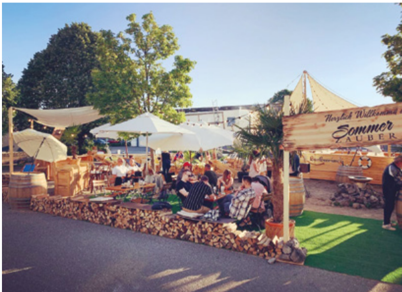
Preisgekrönt, einladend und äusserst lohnenswert – der Sommerzauber in Münchwilen.

Münchwilen – Aus 26 nominierten Hotspots hatten die Radio-Hörerinnen und Hörer die Qual der Wahl. Bei einem knappen und äusserst spannenden Voting haben sich dann fünf aussergewöhnlich schöne und spezielle Locations durchgesetzt, die einen der begehrten Awards ergattern konnten. Unter den ersten fünf platzierte sich als einzige Destination ohne Bademöglichkeit auch ein Hinterthurgauer Hotspot. Mit dem hervorragenden dritten Platz und somit der Bronzemedaille sicherte sich der Sommerzauber Münchwilen einen Eintrag in der «Hall of Fame» der heissesten Plätze für einen einzigartigen und unvergesslichen Sommer.