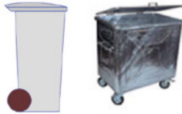
Rollcontainer mit Griff ab 140 Liter

Entsorgungs-Sammelstelle, Waldeggstrasse 7, Werkhof