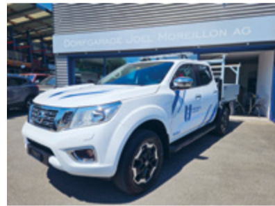
Der Gemeinderat ■

Der Werkhof konnte vor wenigen Tagen das neue Kommunalfahrzeug entgegennehmen. Dieses wurde mit dem Budget 2023 genehmigt. Bei der Beschaffung wurden drei ortsansässige und drei auswärtige Garagisten zur Angebotsabgabe eingeladen. Der Auftrag konnte an das einheimische Unternehmen «Dorfgarage Joel Mor-