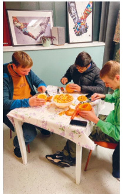
Kürbisschnitzen für Halloween

Seit August 2023 sind die Tore des Jugendtreffs in Münchwilen geöffnet und die Jugendlichen sind herzlich willkommen. Jeden Freitag von 18 bis 22 Uhr gibt es dort Speis und Trank zu fairen Preisen und es werden jeweils verschiedene Unterhaltungs-Angebote durchgeführt. Ab Dezember ist der Jugendtreff auch jeden Mittwoch von 15.15 bis 18 Uhr geöffnet. Wir freuen uns, den Jugendlichen auch dann einen Ort der Wärme, der Geborgenheit und der Unterhaltung anbieten zu können.