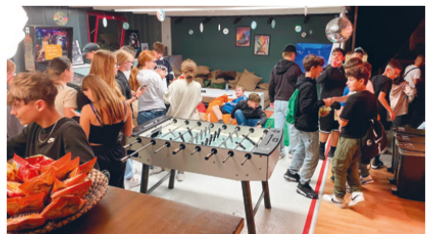
So sieht unser Jugendtreff von innen aus.