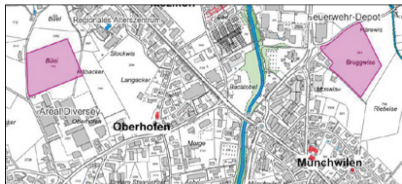
Situation Büel - bisheriges Gewerbeband

Da der Bedarf an Gewerbeland für Münchwiler Gewerbe aktuell aus Sicht der Entwicklungsmöglichkeit grosse Bedeutung hat, wird eine flächengleiche Verlegung an einen optimalen Standort angestrebt. Dafür wurden mehrere Varianten geprüft; als geeignetster Standort stellte sich dabei das Gebiet Bruggwisse heraus, weil es mit